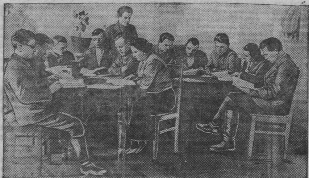
С 25 марта слушатели школы партработников при Доме партийного просвещения перешли на дневные занятия с отрывом от производства. На снимке: слушатели школы за самостоятельной работой по теме: «Партия большевиков в период подготовки и проведения Октябрьской социалистической революции».